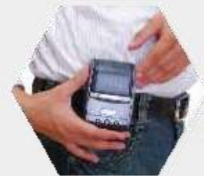
Permite impresión móvil de facturas