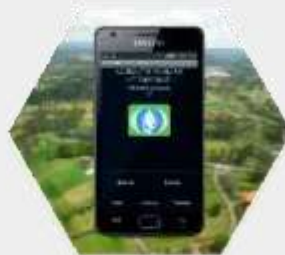
No necesita señal de celular para hacer las lecturas