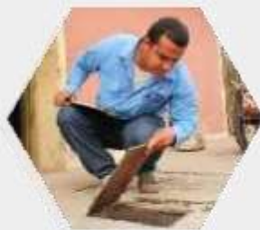
Lecturas de medidores sin lápiz ni papel

Consulte costos del servicio, equipos adicionales y disponibilidad en su municipio